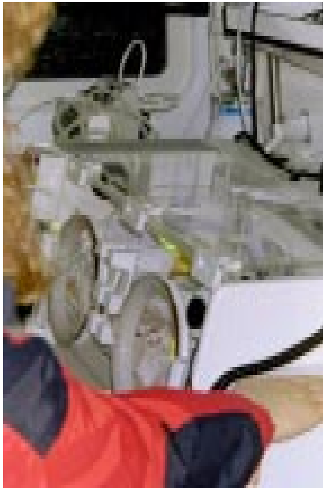
Transportkuvös med flyg från Helsingfors till Göteborg

När dagen för flytten närmade sig blev vi mer och mer nervösa. Tänk om komplikationer skulle uppstå, som gjorde att vi inte kunde åka eller tänk om något skulle hända på väg hem till Sverige. Det snurrade runt i huvudet på oss, men vi hade inte behövt oroa oss. Dagen före flytten kom resekvivösen