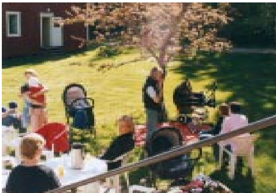
En härlig försommar dag under vårt miniläger i Vekhyttan