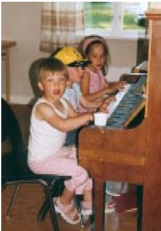
Vi spelar piano...

Vår viktigaste uppgift, våra kontaktföräldrträffar har fortlöpande hållits en gång i månaden med några extramöten helgtid. Vi har i dagsläget ett bra antal kontaktföräldrar men fler är alltid välkomna. Månadsmötena diskuterades också. Dessa har varit relativt glest besökta under den senaste tiden varför vi beslutade oss för att finna andra former där vi kallar till separata medlemsmöten istället. Vi har också haft våra familjeträffar som tidigare men funderade nu på att satsa krutet till ett litet helgläger till våren istället. Detta provade vi i